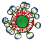
Ecolabel Autrichien 2008