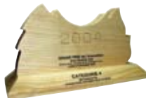
Grand prix de l'innovation Bois Energie France 2004