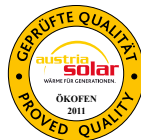
Austria Solar 2009